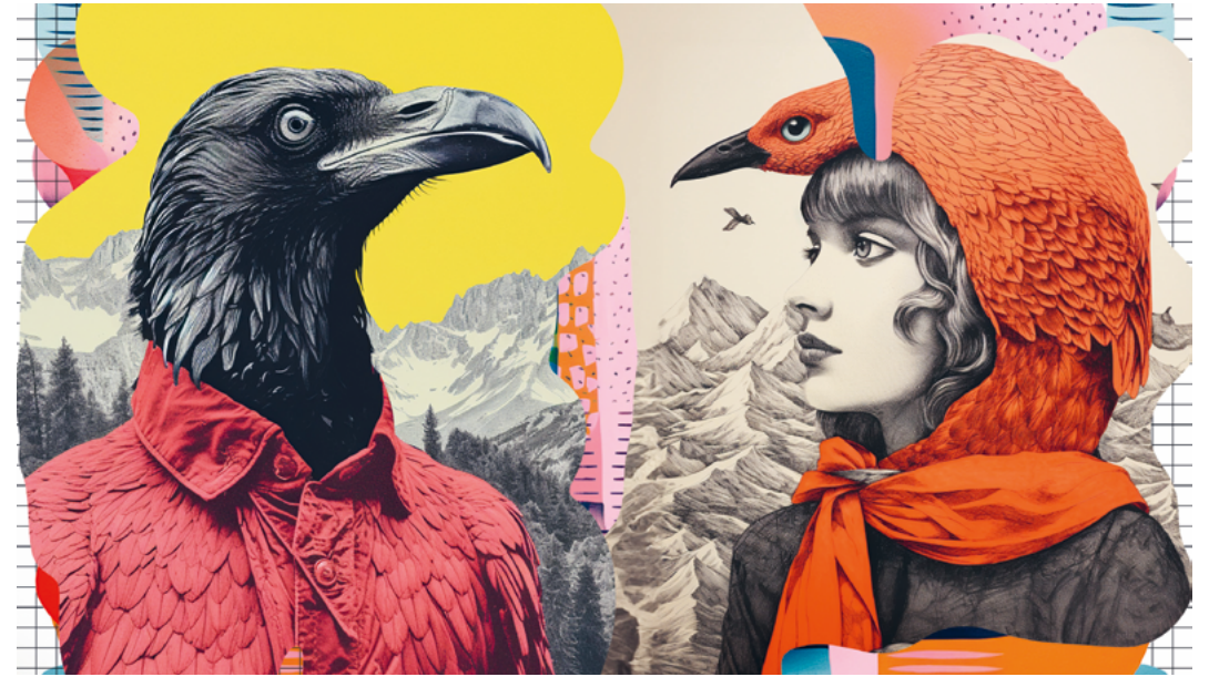
↑ © Nicolas Nova (HEAD - Genève, HES-SO), Sabrina Calvo, Étienne Mineur (Volumique)

Fort du savoir-faire de l'Écomusée du Bois et de la Forêt à Thônes, venez construire votre nichoir qui s'inspirera des caractéristiques de l'architecture d'Avoriaz : le rond, le pan incliné, les toitures en décroché, les volumétries fragmentées.