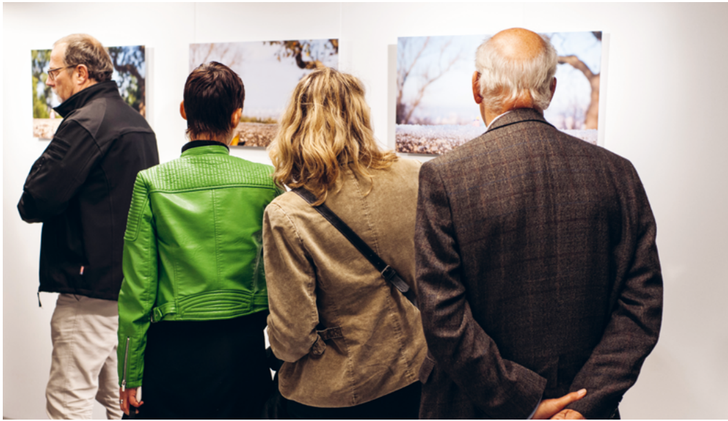
↑ Inauguration de l'exposition « Miniaturesque » à L'îlot-S