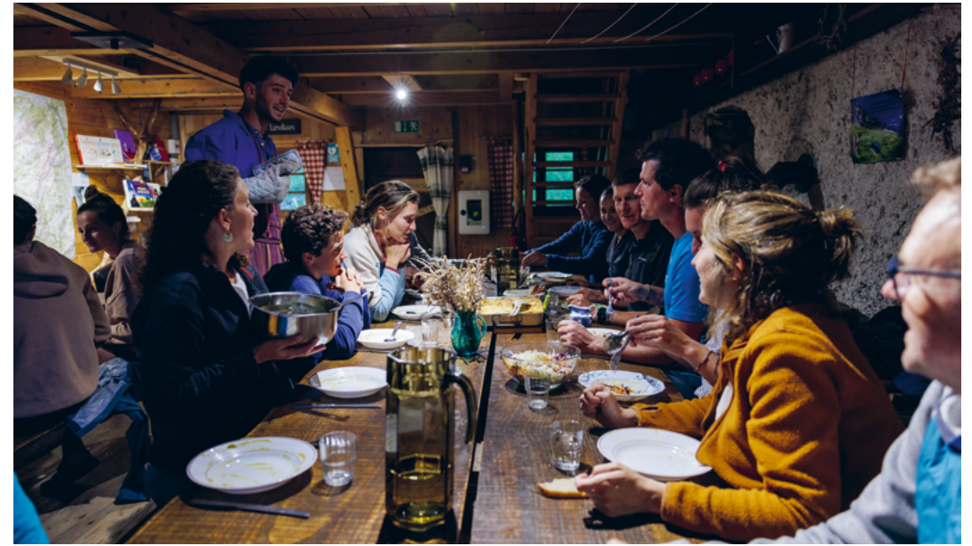
↑ © Alexandre Gendron - ag-photo.fr

L'architecte avoriazien Simon Cloutier raconte l'évolution de la station pour s'adapter aux nouveaux usages et à la montée en gamme de la clientèle. Et la suite ? Quel nouveau paradigme durable ?