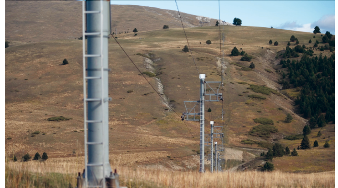
↑ © Aximée Productions

Olivier Cogne remonte le temps dans l'exposition « Alpes - 7000 ans d'histoires » au Musée dauphinois. Vers quel monde meilleur les Alpes souhaitent-ils aller ? Quels scénarios sont en train d'émerger ?