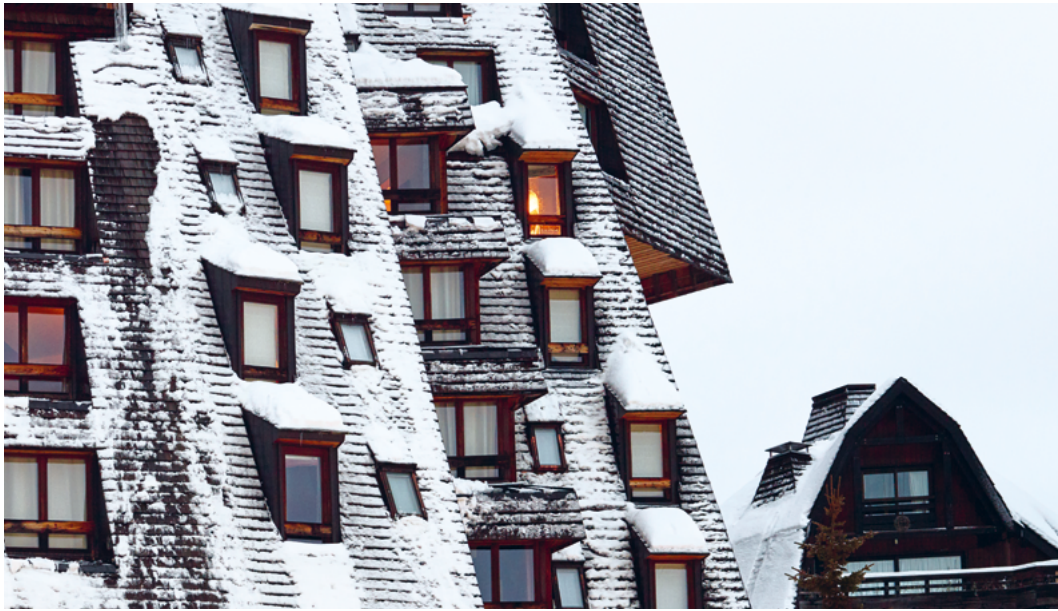
↑ Hôtel des Dromonts