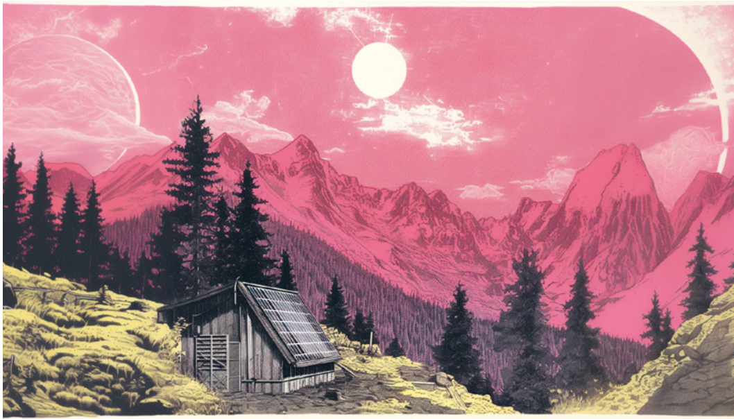
↑ Fin de saison d'automne 2061, Chamonix-Sentinelles, © Nicolas Nova (HEAD - Genève, HES-SO), Sabrina Calvo, Étienne Mineur (Volumique)