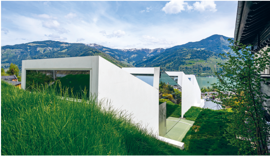
↑ © Frans Parthesius