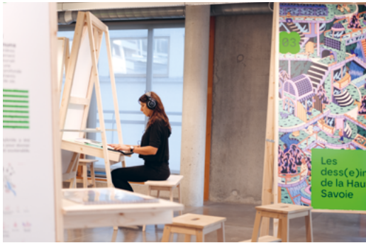
↑ « Réparer le futur » © CAUE de Haute-Savoie