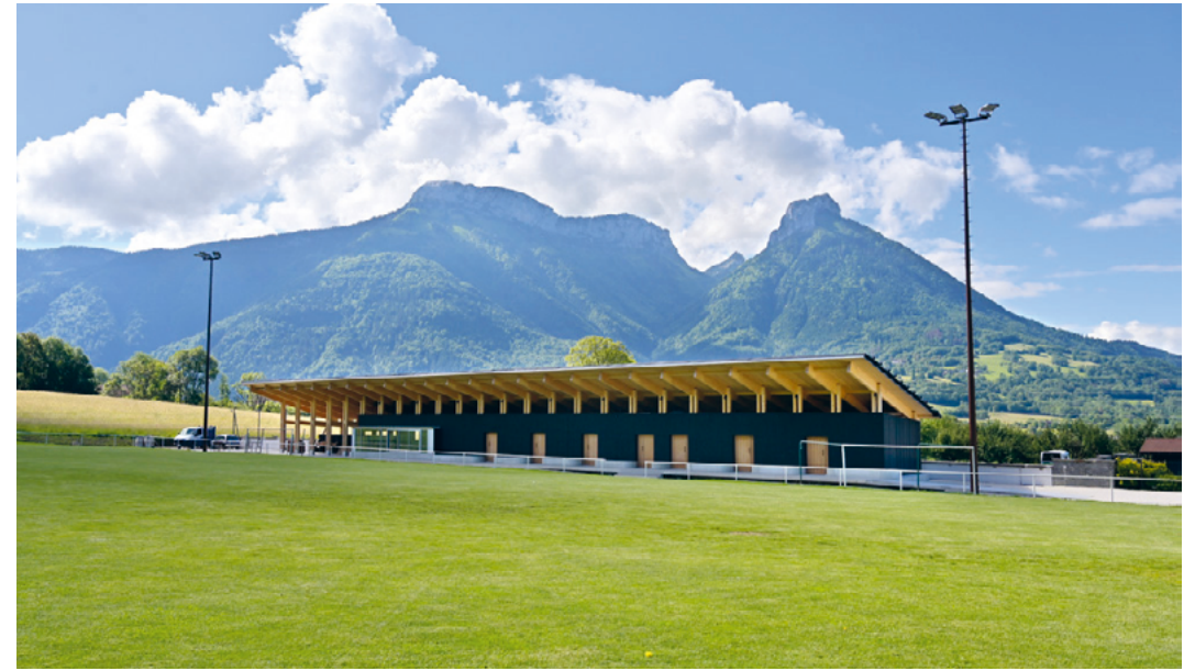
↑ Vestiaire sportif à Dingy-Saint-Clair, FARGA architectes

Un workshop qui promet de belles découvertes et des sensations de glisse garanties alors on enfile sa plus belle combi et on file tout schuss dans le bois!