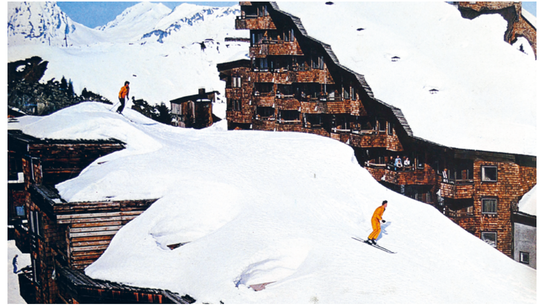
↑ © DR / Office de tourisme Morzine-Avoriaz

Pensez juste à noter ce rendez-vous dans votre agenda!