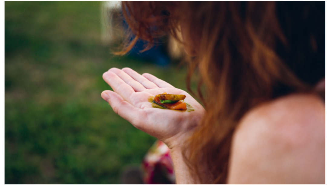
↑ Floraine Facchini

Le cinéma observe la ville et nous invite à échanger sur notre condition urbaine. Bon voyage sur nos écrans.