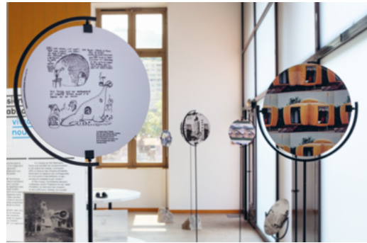
↑ « Conquêtes Spatiales », © Florent Perroud