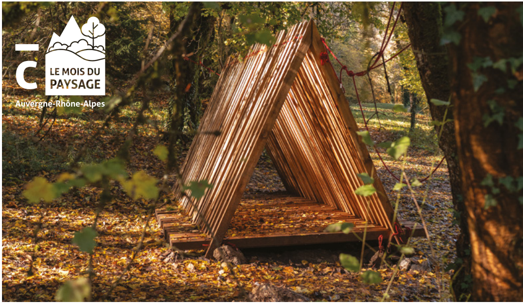
↑ Cabane, édition 2025, des architectes Émilie Schumacher, Pauline Ostermeyer et Charles Paquelet à Giez