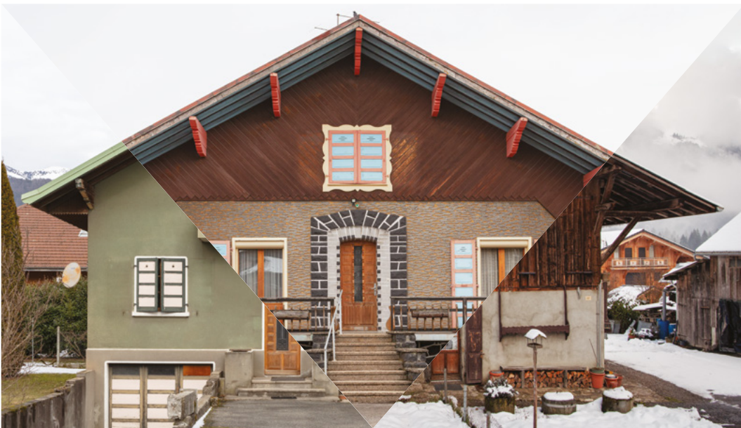
↑ Extrait de l'Atlas des Régions Naturelles - Marignier © Eric Tabuchi / Nelly Monnier