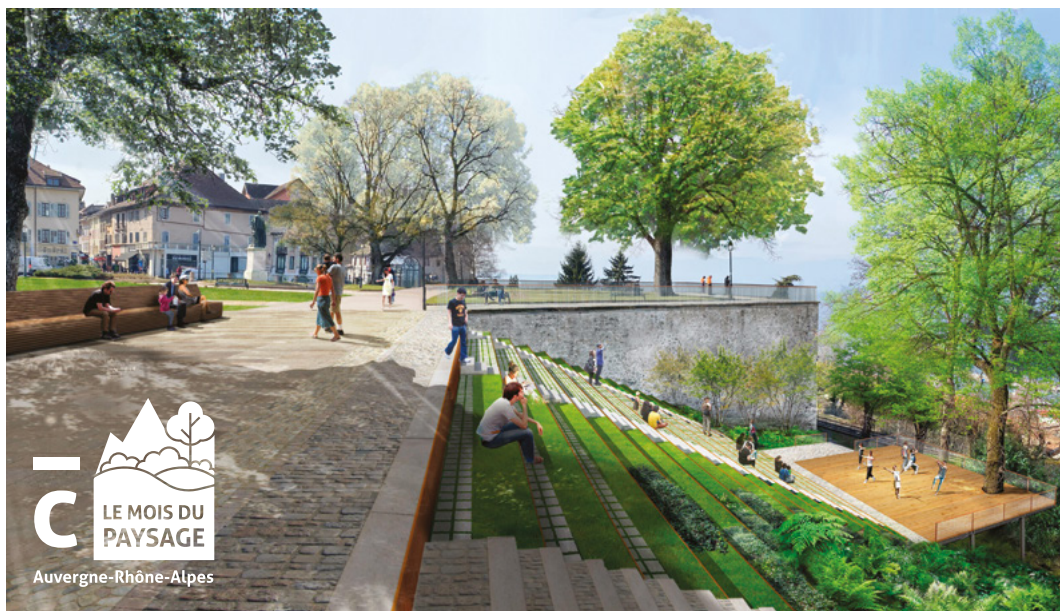
↑ Perspective de projet © MUTABILIS