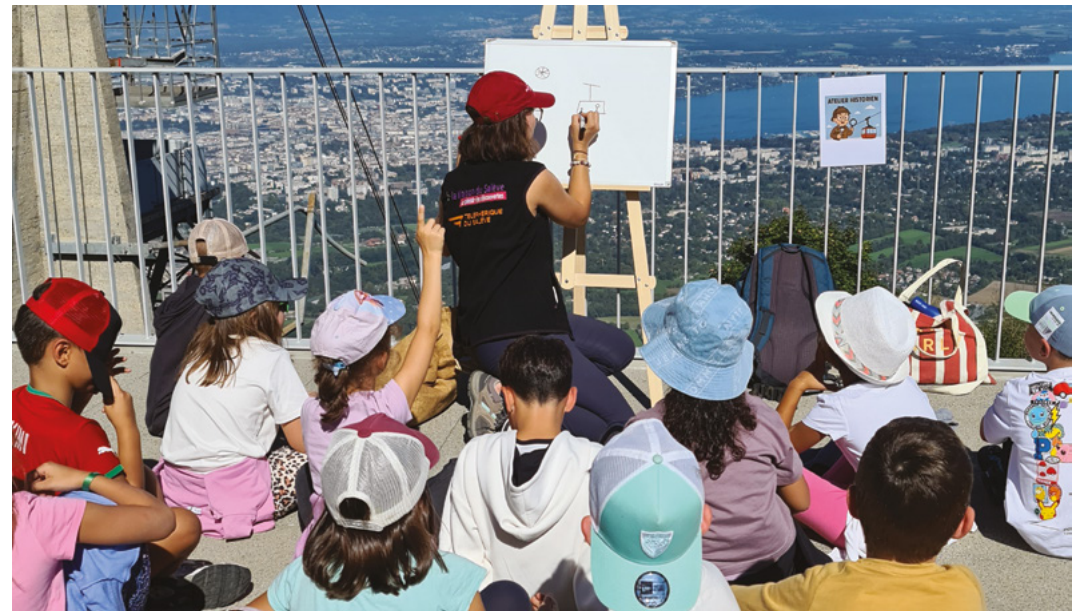
↑ Atelier pédagogique au téléphérique du Salève, 2025

Nous recevons aussi les scolaires gratuitement.