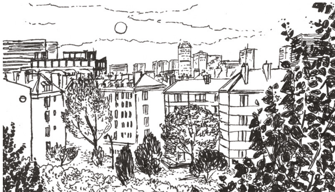
↑ Croquis urbain © Julie-Amadéa Pluriel