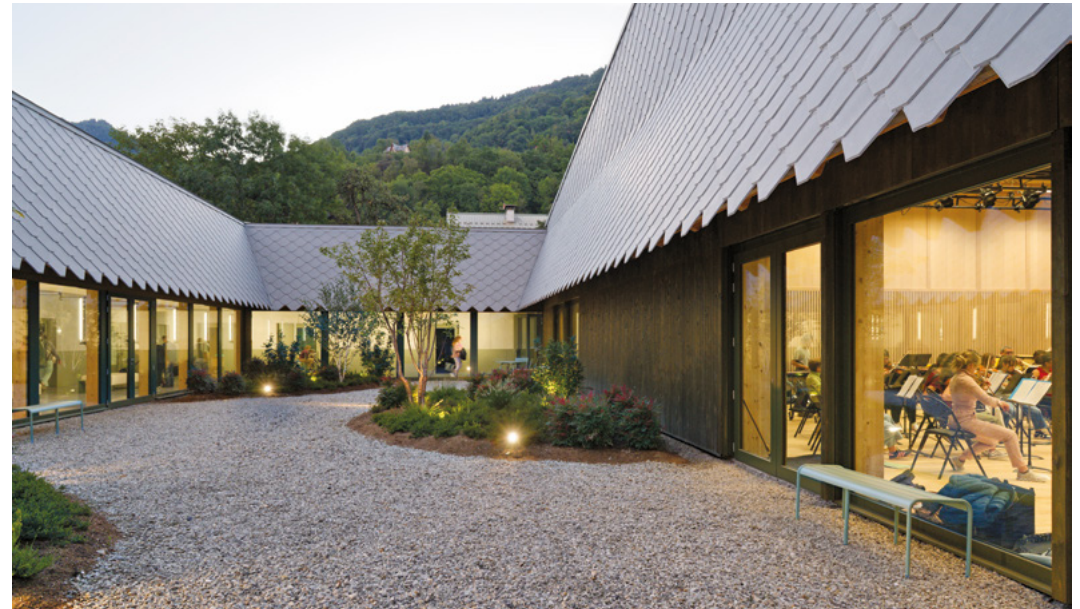
↑ École de musique de Sallanches

questionner leur regard sur la singularité des paysages du quotidien et le mettre en pratique in situ dans la ville.