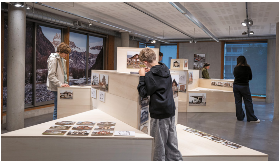
↑ Exposition modernité ordinaire