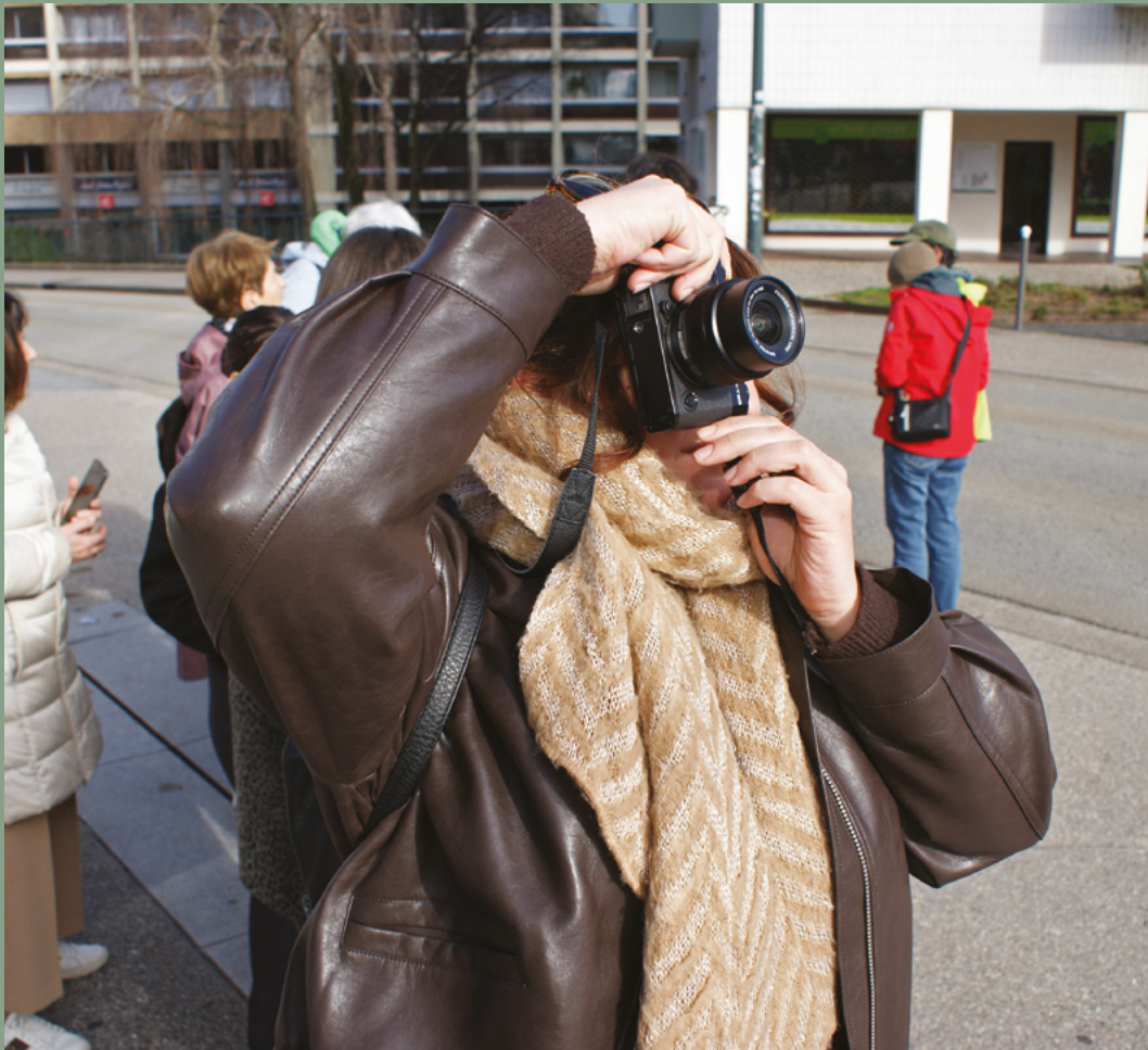
↑ Workshop "clichés ordinaires"