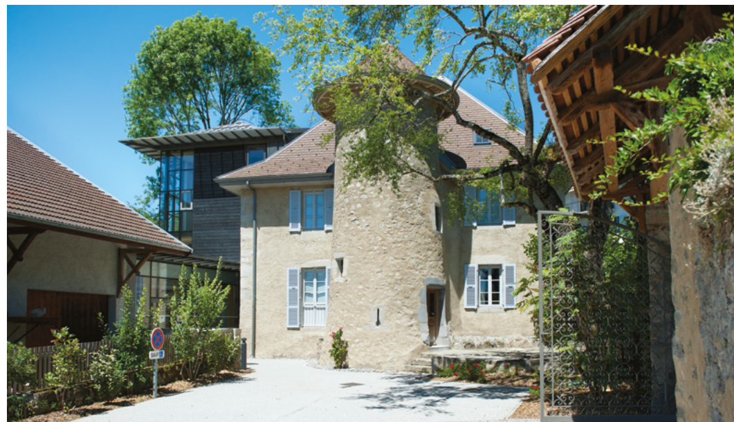
↑ Le Manoir des Livres, Lucinges

Nous vous invitons à découvrir cette nouvelle infrastructure qui s'inscrit dans une démarche d'urbanisme plus vaste. Elle vise à la modernisation du centre-ville avec la création d'une nouvelle place centrale pouvant accueillir des manifestations, ainsi que le marché grâce à sa nouvelle halle couverte. Cette mission, à mi-chemin de l'architecture et de l'urbanisme, touche directement à la métamorphose sociologique de Scionzier. Elle a été confiée à l'agence d'architectes Archiplein, en collaboration avec le bureau d'études Arborescence, l'entreprise de charpente LPS et le muséographe Philippe Maffre, de l'agence MAW.