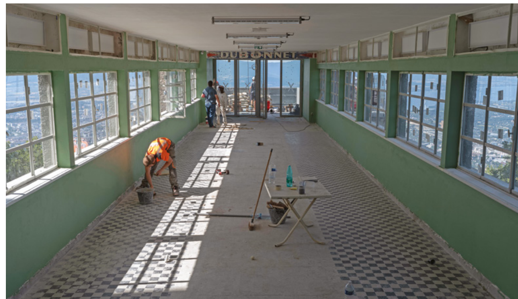
↑ Réhabilitation du téléphérique du Salève

Nous vous accueillons un jeudi par mois, à 18h30, pour discuter de tout et surtout de ce qui nous habite – au sens propre comme au figuré.