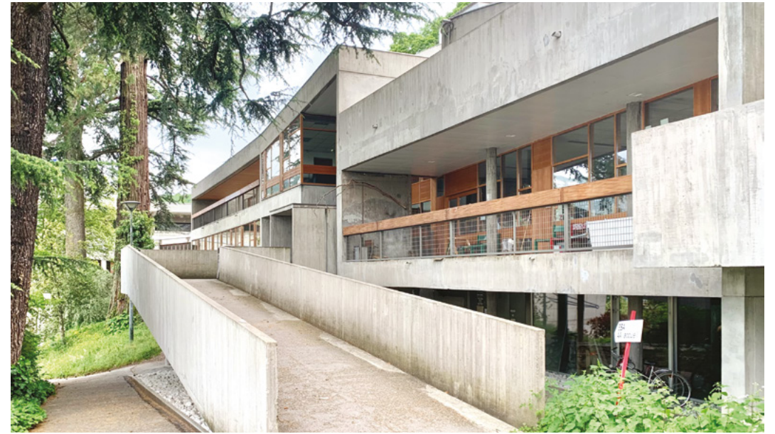
↑ ESAAA, Annecy © Stéphan Dégeorges

L'après-midi sur le terrain sera l'occasion de visiter plusieurs cabanes construites ou en cours de finalisation de leur construction, d'appréhender leur rapport au paysage et les perspectives de réflexions qu'elles amènent sur notre façon d'habiter les territoires ruraux.