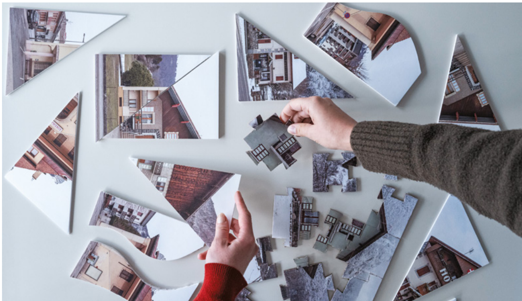
↑ Puzzles pédagogiques de l'exposition "modernité ordinaire" © Anthony Denizard