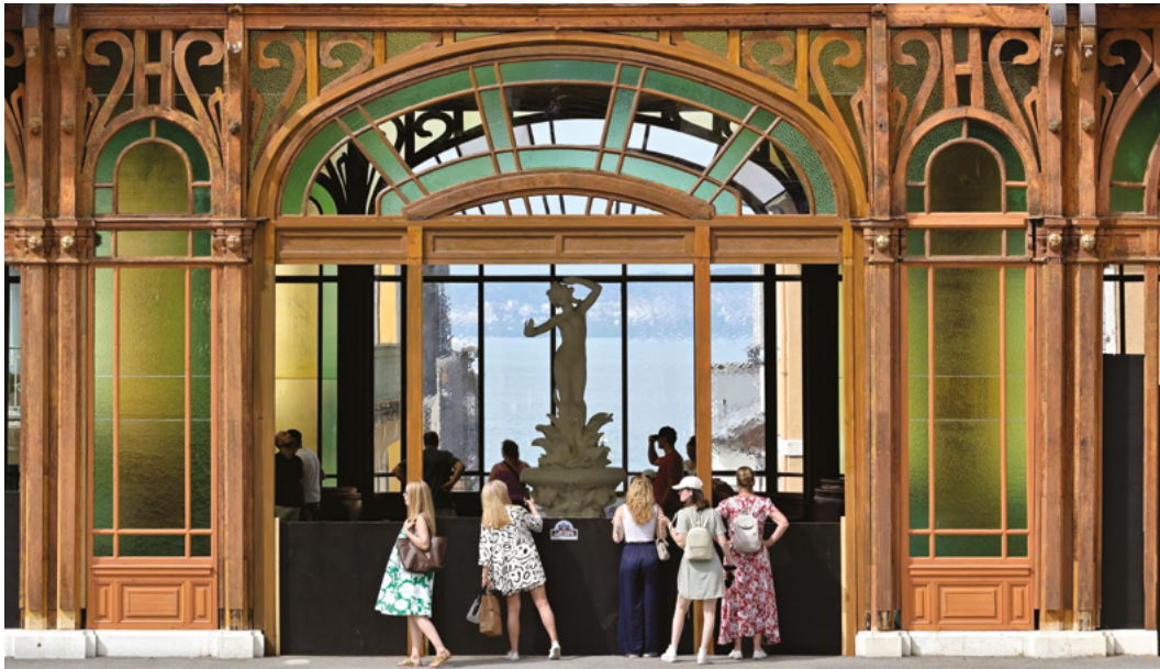
↑ Buvette Cachat