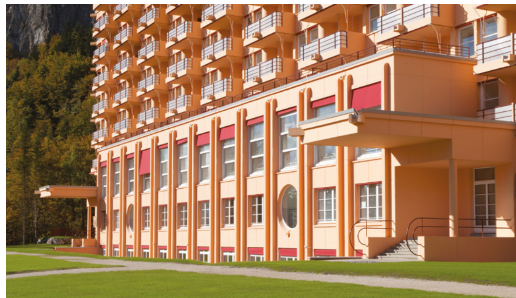
↑ Sanatorium Martel de Janville

La visite sera commentée par l'agence Mutabilis, concepteur du projet.