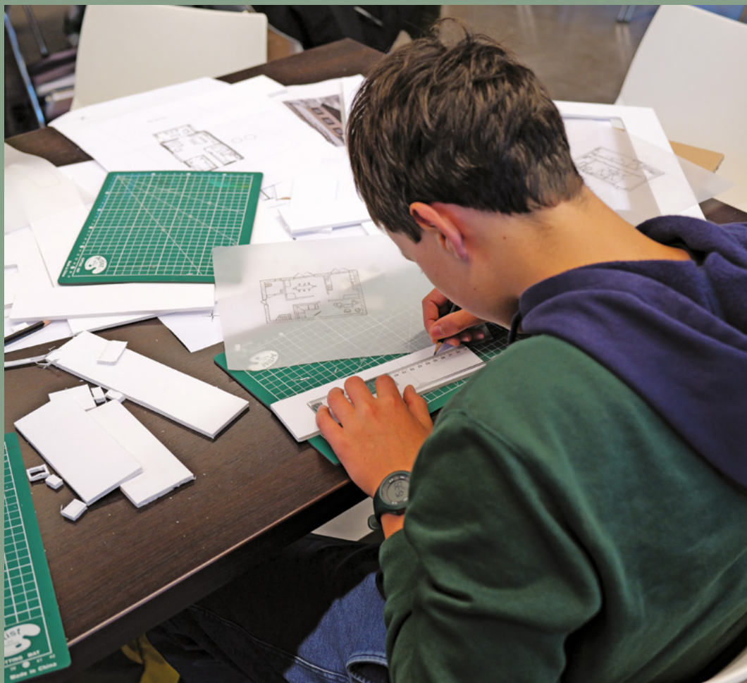
↑ Workshop "dans la peau d'un architecte"