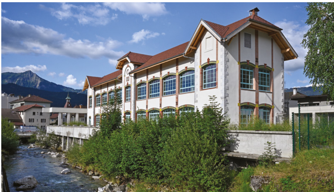
↑ Usine Alpex de Scionzier