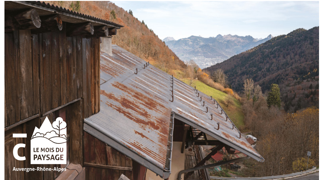
↑ Novel, plus petite commune de Haute-Savoie

La buvette Cachat, le Palais lumière et le Casino sont de ces édifices au destin chahuté qui contribuent aujourd'hui à la splendeur de la ville. La buvette Novarina-Prouvé, plus récente, est encore dans un état d'attente. Reconnue par les spécialistes comme une œuvre majeure, elle peine encore à être appréciée. Sa visite pourra nous convaincre de la qualité exceptionnelle de sa conception.