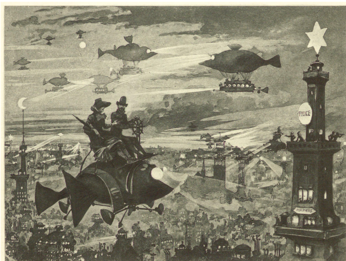
A Robida del.

Science du temps long, la prospective permet de penser avant d'agir pour rendre plus probable un futur meilleur, désiré et co-construit. Dans l'exercice prospectif, le futur est déjà là. Il se construit avec toutes et tous, ici et maintenant.