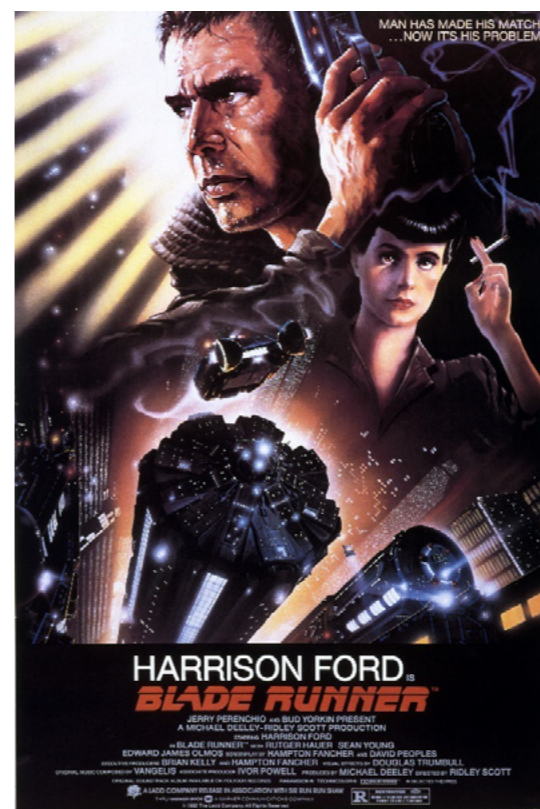
Affiche de Blade Runner, Ridley Scott, 1982 © 1982 Warner Bros. Entertainment Inc. All rights reserved.