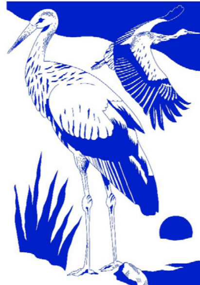
Cigogne © Quentin Caillat

L'artiste annécien Quentin Caillat jouit d'une formation aux techniques traditionnelles et digitales de dessin à l'école Emile Cohl. Troquant un ridicule doudou pour un chic crayon dès le berceau, Quentin n'a jamais cessé de dessiner depuis. En constante recherche de mieux, il aiguise ses outils d'année en année pour améliorer toujours plus sa technique. Avec sa palette de couleurs restreinte et hypnotique, Quentin construit des scènes nocturnes intrigantes, qui nous convaincraient presque de dire adieu à la lumière du jour.