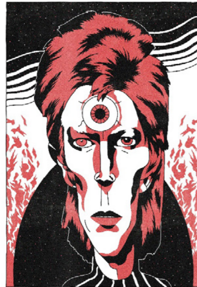
David Bowie