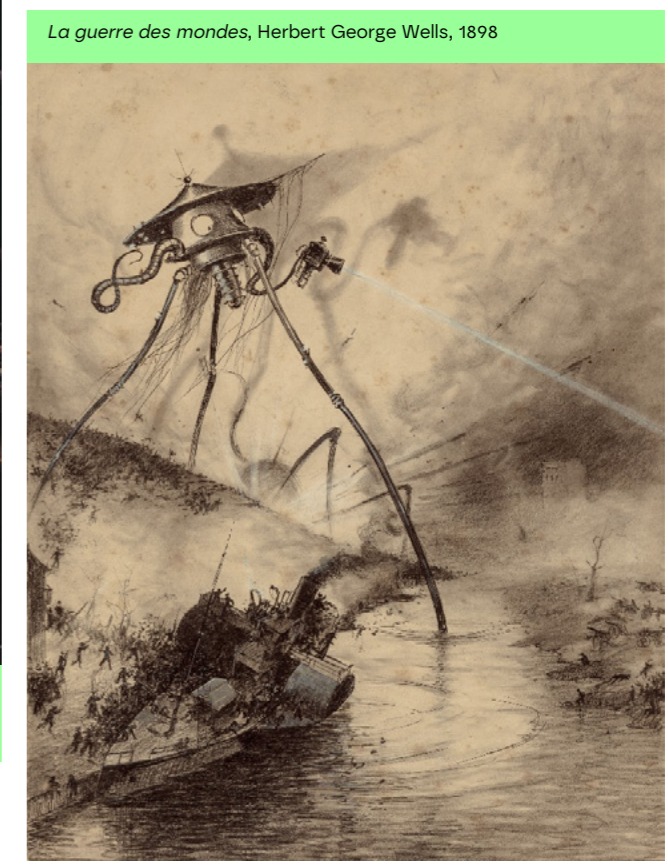
La guerre des mondes, Herbert George Wells, 1898