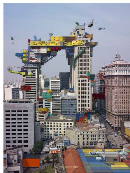
Alain Bublex, Plug-In City (2000), Sao Paulo 093, épreuve chromogène laminée diasec sur aluminium, 2016 © Alain Bublex