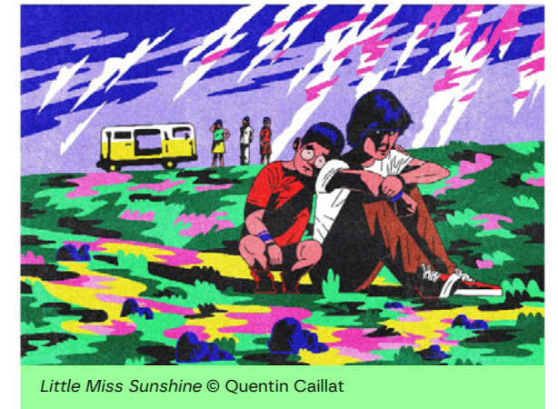
Little Miss Sunshine © Quentin Caillat

L'artiste annécien Quentin Caillat jouit d'une formation aux techniques traditionnelles et digitales de dessin à l'école Emile Cohl. Troquant un ridicule doudou pour un chic crayon dès le berceau, Quentin n'a jamais cessé de dessiner depuis. En constante recherche de mieux, il aiguise ses outils d'année en année pour améliorer toujours plus sa technique. Avec sa palette de couleurs restreinte et hypnotique, Quentin construit des scènes nocturnes intrigantes, qui nous convaincraient presque de dire adieu à la lumière du jour.