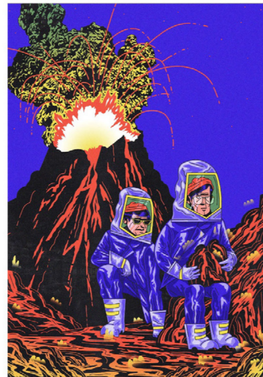
Vulcanologue © Quentin Caillat

À travers l'univers conçu pour l'exposition « Réparer le futur », Quentin Caillat et le studio de graphisme YAY (Loriane Montaner et Fanny Durand) vous invitent à pénétrer des villes imaginaires, où s'enchevêtrent architectures, végétaux et personnages dans des scènes déjantées et burlesques !