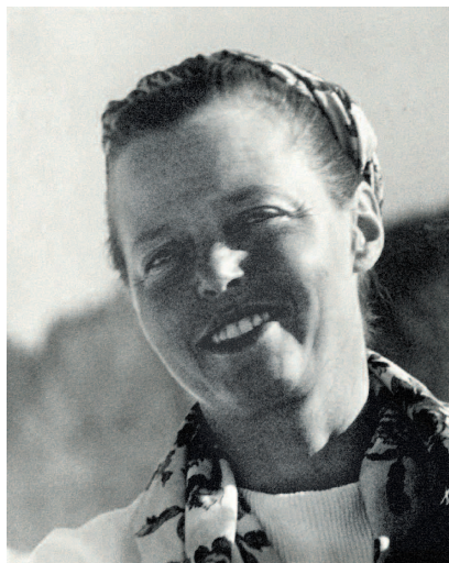
Charlotte Perriand à Megève en 1948.

Le texte central de l'auteur et les deux contributions d'architectes, anciens collaborateurs de Charlotte Perriand, sont suivis d'une synthèse de ses réalisations ainsi que sa biographie et une bibliographie.