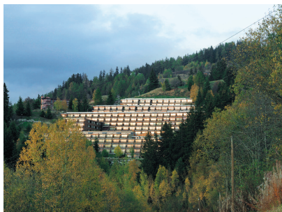
Ensemble résidentiel Versant sud et Adret, Arc 1600 (Savoie), 1969. Charlotte Perriand en collaboration avec AAM, Gaston Regairaz.

Gaston Regairaz (1930-2013), architecte-urbaniste, il rejoint en 1958 l'Atelier d'architecture en montagne. Pendant plus de vingt ans, jusqu'en 1989, il travaille sur la plupart des projets d'Arc 1600 et d'Arc 1800, en équipe avec Charlotte Perriand. Il a écrit le texte qui figure dans ce livre en 2006 à la demande de Pernelle Perriand-Barsac et Claire Grangé, dans le cadre de leurs recherches pour l'exposition Charlotte Perriand et la montagne .