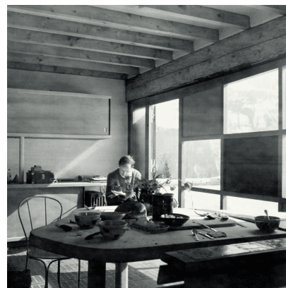
Le Vieux Matelot, Saint Nicolas de Véroce (Haute-Savoie), 1938. Salle de séjour avec la porte fenêtre pivotante en position fermée. Charlotte Perriand, architecte. Photographie Charlotte Perriand. AChP/Charlotte Perriand © ADAGP, Paris 2016